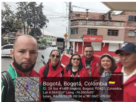
1.FOTOGRAFIA: INICIO DE ACTIVIDAD