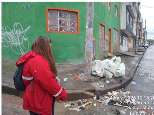
3.FOTOGRAFIA: PUNTO CRITIO