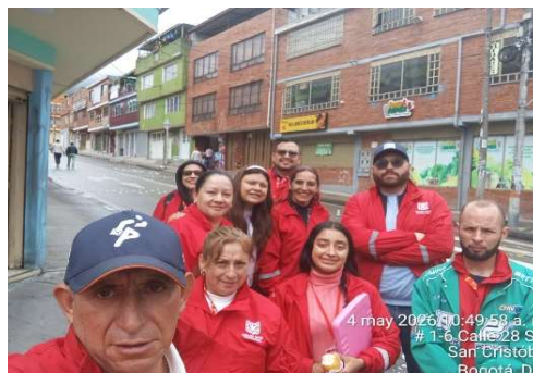
4. FOTOGRAFIA: FINALIZACION DE ACTIVIDAD