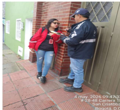
2.FOTOGRAFIA: SENSIBILIZACION A LA COMUNIDAD